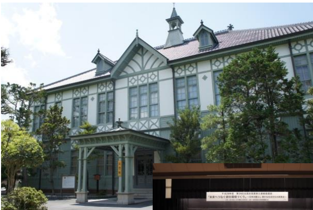
奈良女子大学記念館 (旧本館)重要文化財 ※会場： 奈良女子大学講堂