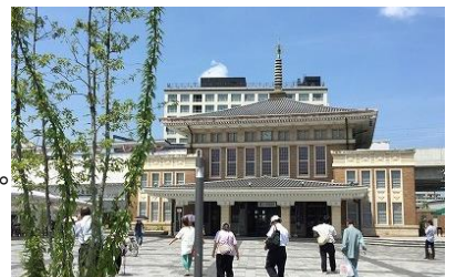
※奈良市総合観光案内所(旧 JR 奈良駅の駅舎)

応急危険度判定について、防災委員会の活動報告の中で、神奈川県が被災県になった場合の課題項目で、他県からの応援を受け入れる時のコーディネーターの人材養成が急務であることについて、今回被災した熊本県の状況をお伺いしました。当初熊本では応急危険度判定を1週間から10日で終わらせる予定でしたが、1カ月たっても終わっていない町(益城町)がありました。そのため今後活動方法を考える必要があると言われていました。また、女性建築士の方には、雑魚寝をしたりする関係で判定作業を遠慮して頂いたとの事でした。また、東日本大震災時、宮城県では応急危険度判定を他県に要請しない方針が出されたそうです。「水・食料・寝る場所を確保できない」との理由で断ったと震災後1年半たって応急危険度判定士が集まった席で県の職員の方から聞かされたそうですが、神奈川も今から被災県になった場合を想定して、平時からできる検討を一つひとつ重ねる必要を感じました。神奈川からは、神奈川県主催の仮設住宅の建設に関するワークショップに出席し、防災委員会の活動の報告を行ったこととホームページを読んでもくださいとアピールして分科会を終えました。各県の方と有意義な議論が出来たA分科会でありました。