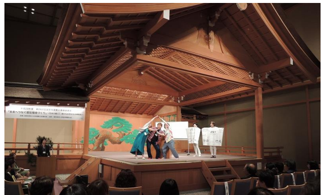
※全体会 能舞台でのA分科会発表

観光どころではない全建女でしたが、発表者という経験が出来た事に感謝しております。