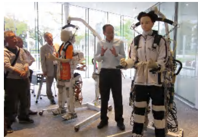
パワーアシストスーツ

平成26年9月20日（土）に、小田原地方・県央・中の3支部共催事業「歴史及び現代建築をめぐる見学バスツアー」を開催しました。 小田原駅を出発し松永記念館と内野邸、その後大磯で鴨立庵と旧島崎藤村邸を見学。平塚での昼食を挟み八幡山の洋館と一期工事が完了した平塚市新庁舎を外から眺め県央エリアへ。山十郎、神奈川工科大学内「先進技術研究所」の見学後、お楽しみ会の懇親会は厚木シロコロホルモンでした。初